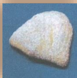
マンゴークリームパイ 150円+税