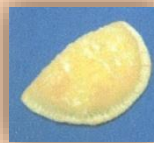
完熟トマトのカルツォーネ 150円+税